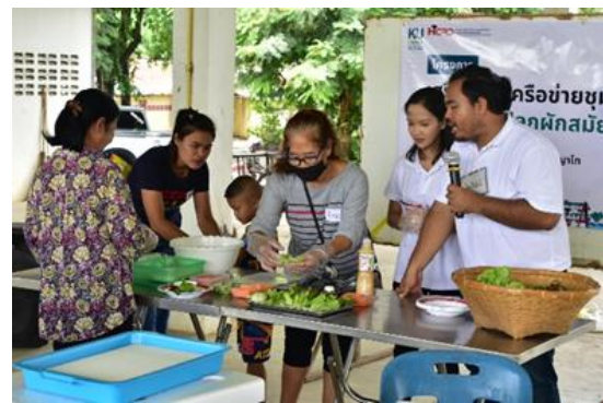
Figure 7 Learning Activities on Growing Vegetables in a New Way through the Participation of Network Partners (กิจกรรมการเรียนรู้วิถีปลูกผักสมัยใหม่ผ่านการมีส่วนร่วมของภาคีเครือข่าย)