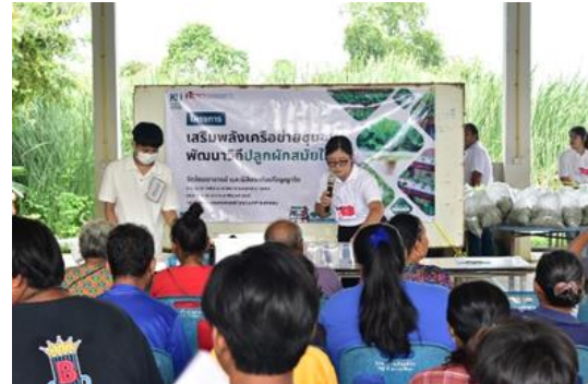
Figure 3 Learning Activities on Growing Vegetables in a New Way through the Participation of Network Partners (กิจกรรมการเรียนรู้วิถีปลูกผักสมัยใหม่ผ่านการมีส่วนร่วมของภาคีเครือข่าย)