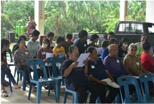
Figure 2 Figure 2: Learning Activities on Growing Vegetables in a New Way through the Participation of Network Partners (กิจกรรมการเรียนรู้วิถีปลูกผักสมัยใหม่ผ่านการมีส่วนร่วมของภาคีเครือข่าย)