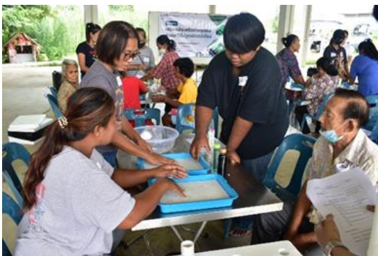
Figure 6 Learning Activities on Growing Vegetables in a New Way through the Participation of Network Partners (กิจกรรมการเรียนรู้วิถีปลูกผักสมัยใหม่ผ่านการมีส่วนร่วมของภาคีเครือข่าย)