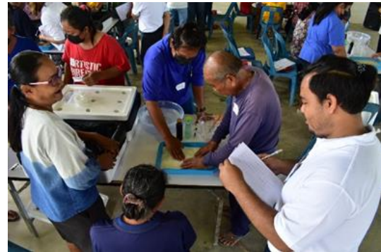
Figure 5 Learning Activities on Growing Vegetables in a New Way through the Participation of Network Partners (กิจกรรมการเรียนรู้วิถีปลูกผักสมัยใหม่ผ่านการมีส่วนร่วมของภาคีเครือข่าย)