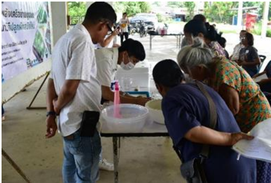
Figure 4 Learning Activities on Growing Vegetables in a New Way through the Participation of Network Partners (กิจกรรมการเรียนรู้วิถีปลูกผักสมัยใหม่ผ่านการมีส่วนร่วมของภาคีเครือข่าย)