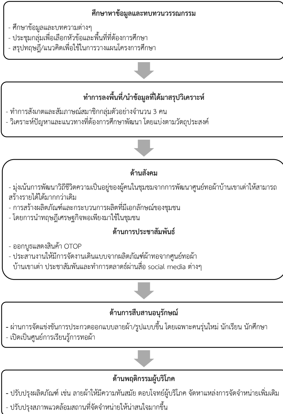
ภาพที่ 1 กรอบแนวคิดในการวิจัย