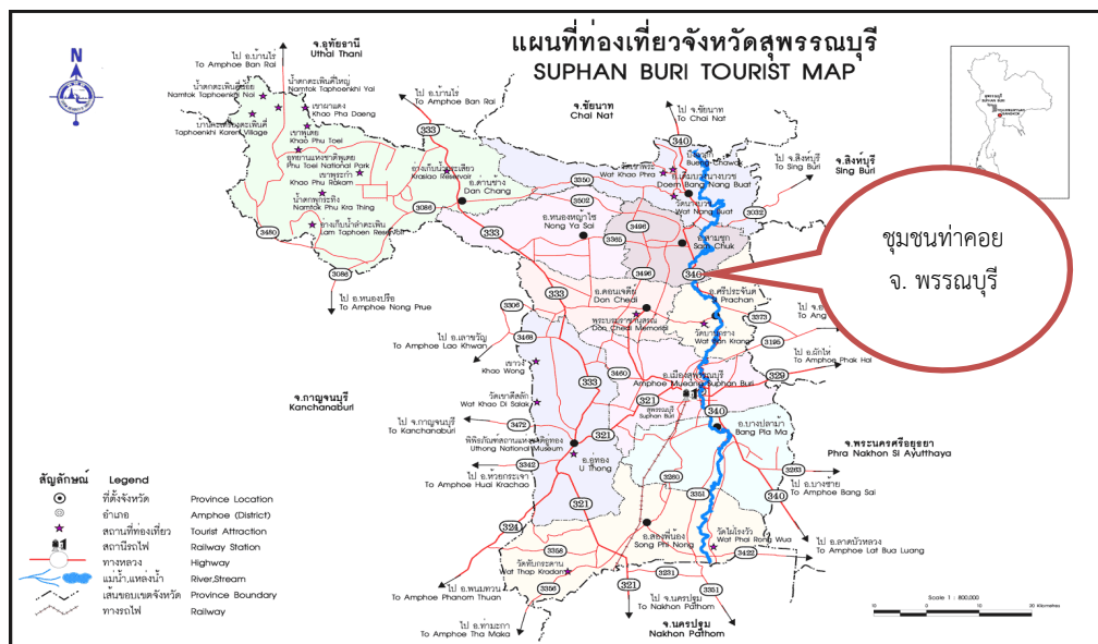
ภาพที่ 2 แผนที่ชุมชนท่าคอย