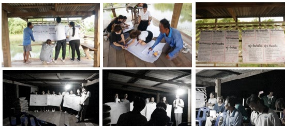
ภาพที่ 2-7 กิจกรรมการถอดการประชุมนย่อย ณ ชุมชนห้วยม่วง ในวันที่ 18 กันยายน 2561