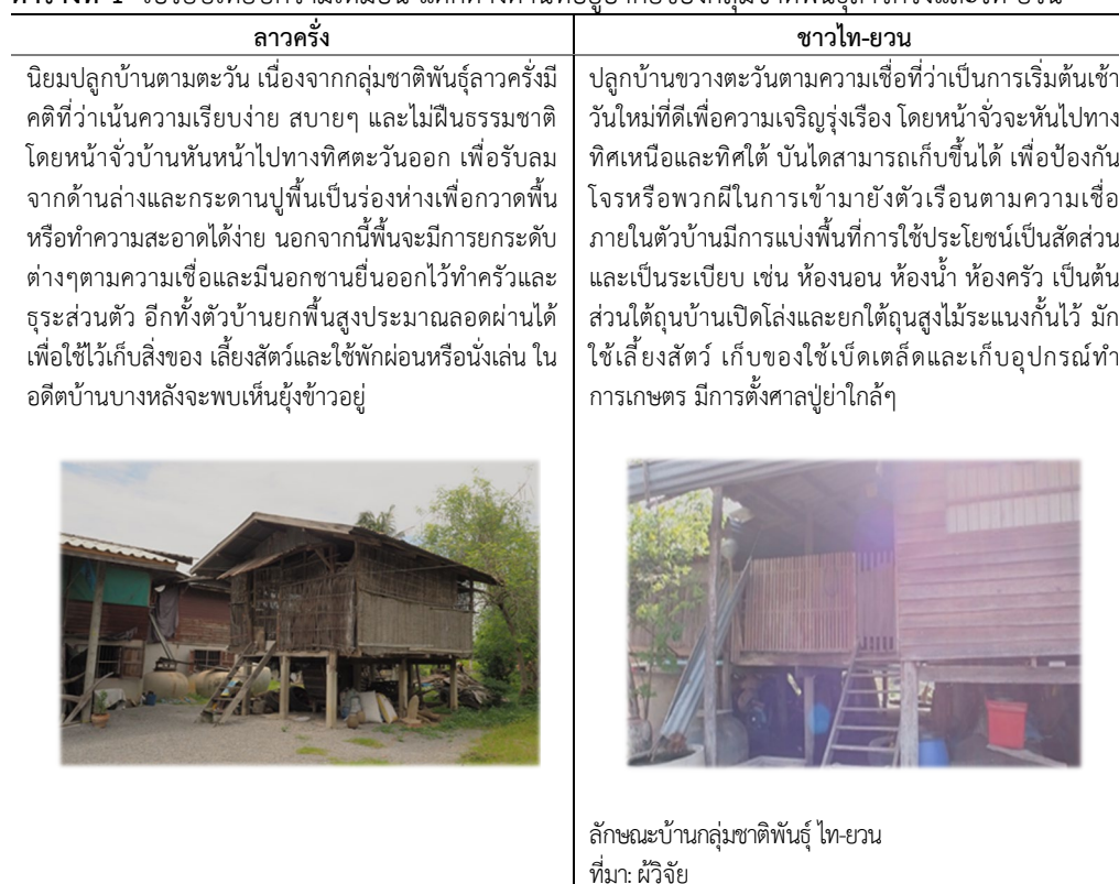
ตารางที่ 1 เปรียบเทียบความเหมือน-แตกต่างด้านที่อยู่อาศัยของกลุ่มชาติพันธุ์ลาวครึ่งและไท-ยวน

ด้านการแต่งกาย สะท้อนให้เห็นถึงความเป็นกลุ่มชาติพันธุ์ที่มีความแตกต่างกันโดยสิ้นเชิง ซึ่งกลุ่มชาติพันธุ์ลาวครึ่งจะมีแต่งกายแบบเรียบง่าย แต่กลับกันกลุ่มชาติพันธุ์ไท-ยวน มีการแต่งกายที่ค่อนข้างประณีตในการจกลดลายลงบนผ้า ดังนั้นจะเห็นได้ว่าการแต่งกายของกลุ่มชาติพันธุ์ทั้งสองกลุ่มนี้มีความเป็นอัตลักษณ์ที่ชัดเจนและสามารถอยู่ร่วมกันได้ภายในชุมชน ตามตารางที่ 2