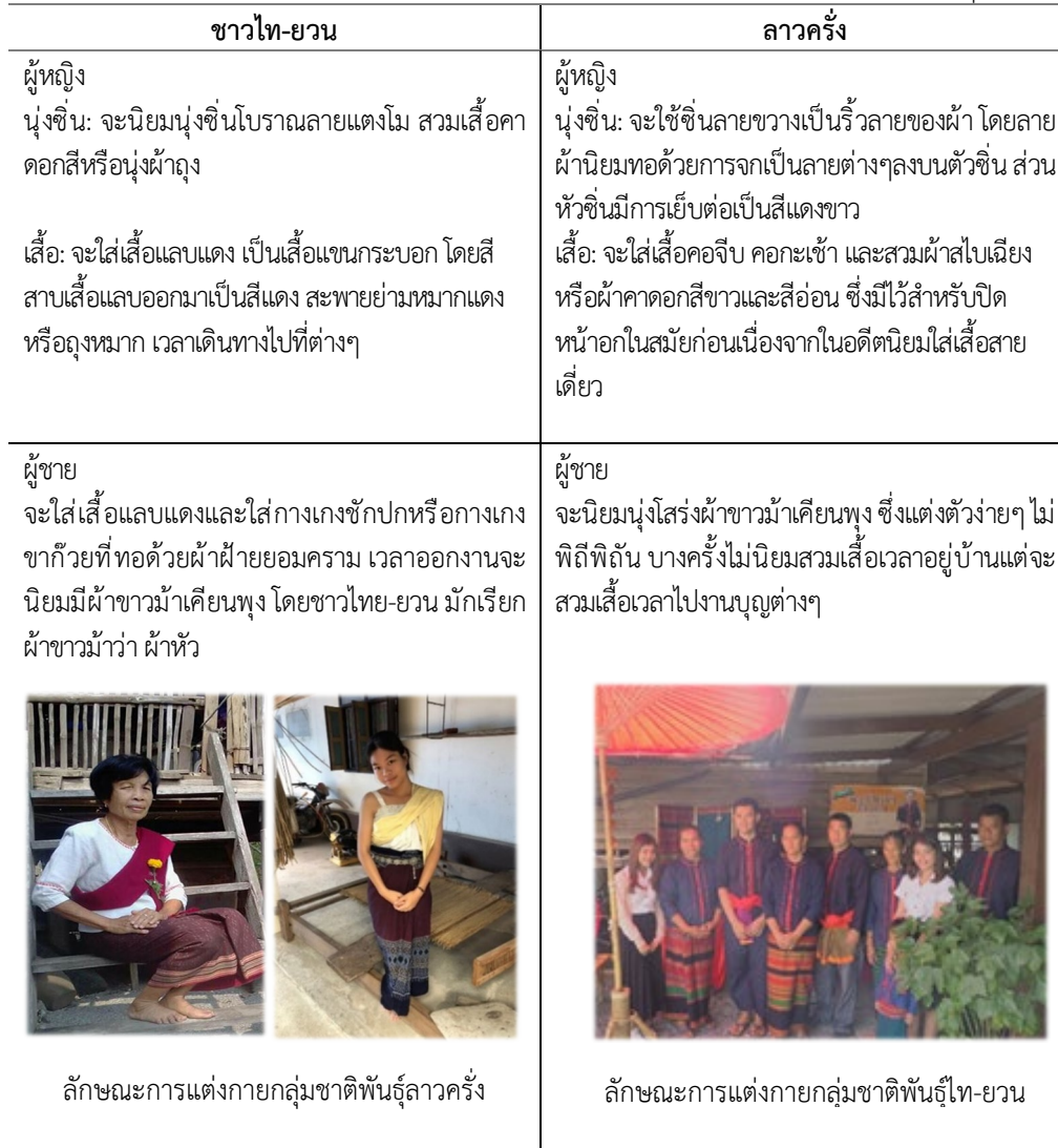
ตารางที่ 2 เปรียบเทียบความเหมือนและความแตกต่างด้านการแต่งกายของชาวลาวครึ่งและกลุ่มไท-ยวน

ด้านภาษา ชาวไท-ยวนเป็นกลุ่มชนที่มีภาษาและตัวอักษรเป็นของตนเองใช้มาตั้งแต่ครั้งมีถิ่นฐาน อยู่ที่ดินแดนล้านนา เมื่อถูกกวาดต้อนมาอยู่ในภาคกลางของประเทศไทยก็ได้นำเอาภาษาและอักษรของ ตนเข้ามาใช้ด้วย และเมื่อเวลาผ่านไปร้อยปีกว่าปี ภาษาพูดยังคงใช้อยู่ในหมู่คนสูงอายุ ส่วนภาษาเขียนนั้น ไม่ปรากฏว่ามีชาวไท-ยวนสามารถเขียนได้เลย ส่วนชาวลาวครึ่งเป็นกลุ่มชนที่มีภาษาที่ใช้มาตั้งแต่ครั้งมีถิ่น ฐานมาจากเวียงจันทน์ จนถูกกวาดต้อนมาอยู่ในภาคกลางเขตของนครชัยศรีจังหวัดนครปฐม หลังจากนั้นได้มี การอพยพย้ายถิ่นฐานมายังชุมชนห้วยม่วงเนื่องจากเกิดอหิวาตกโรคและมีชาวบ้านเสียชีวิตเป็นจำนวนมาก และปัจจุบันยังคงมีภาษาพูดที่ใช้สื่อสารกันในกลุ่มของผู้สูงอายุ ทั้งนี้มีประโยชน์-การพูดที่ใช้ใน ชีวิตประจำวัน ตามตารางที่ 3