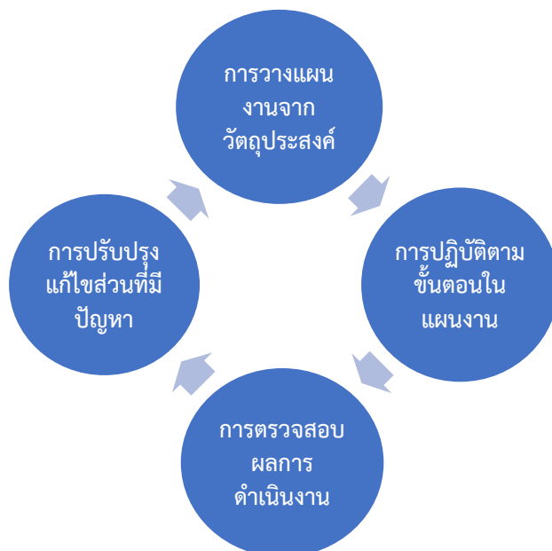
ภาพที่ 1 แนวทางการพัฒนาศักยภาพการท่องเที่ยวอุทยานประวัติศาสตร์พระนครคีรี (เขาวัง)