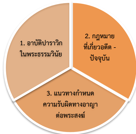
ภาพที่ 2 ความรับผิดชอบทางอาญาต่อพระสงฆ์ที่ประพฤติดิถีตามพระธรรมวินัย

จากการศึกษาแนวทางการกำหนดความรับผิดชอบทางอาญาต่อพระสงฆ์ที่อาบัติปาราชิก สามารถสรุปความเป็นมาของการอาบัติปาราชิกกรณีการอวดอุตริมนุสธรรมตามพระธรรมวินัย หลักเกณฑ์แห่งกฎหมายที่เกี่ยวข้อง เพื่อนำไปสู่การกำหนดความรับผิดชอบทางอาญาต่อพระสงฆ์ที่ประพฤติดิถีตามพระธรรมวินัย โดยจะนำเสนอผลการศึกษาออกไป 3 ส่วน ดังต่อไปนี้