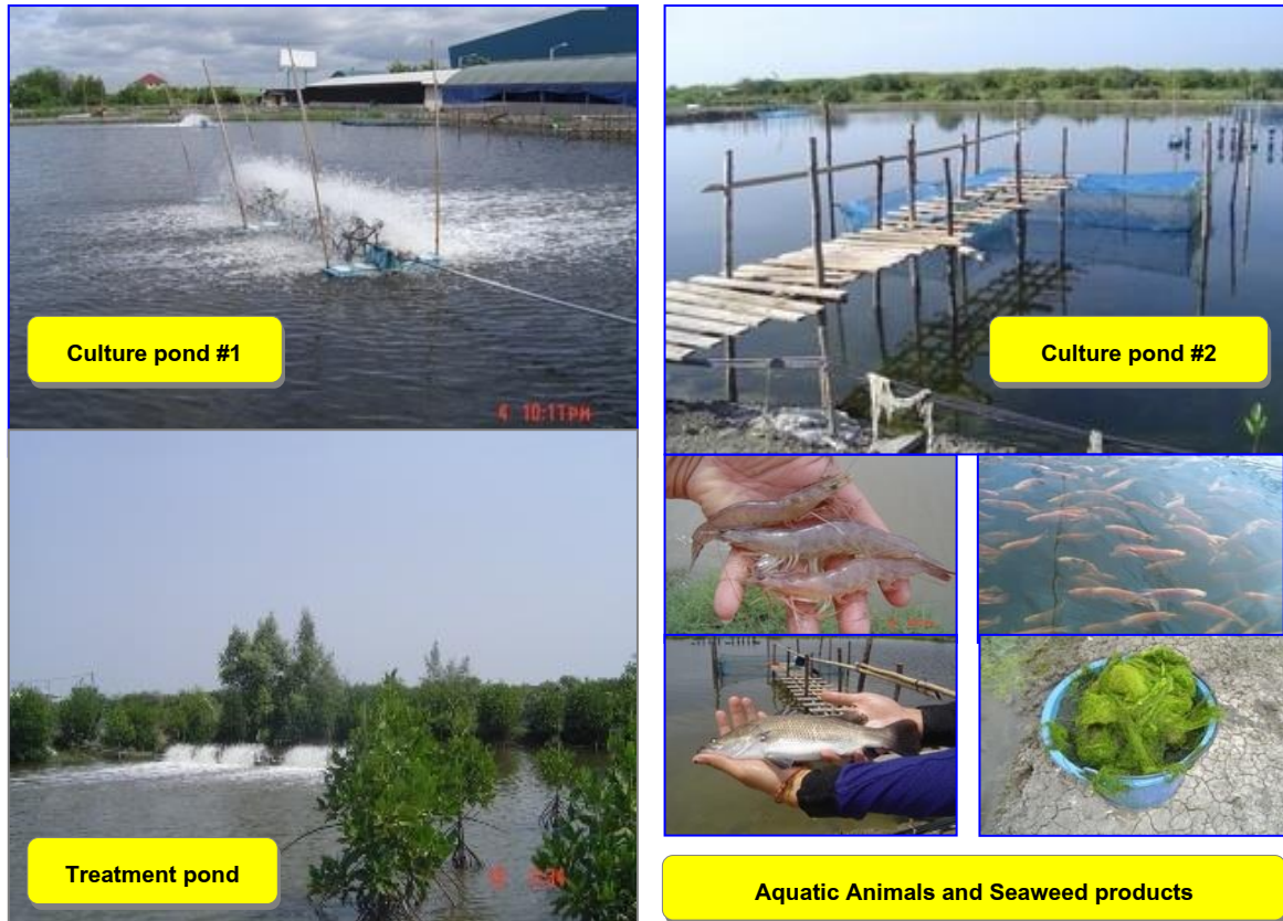
Figure 2 Integrated aquaculture farming system and products